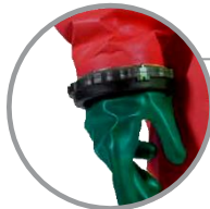
Рукава, герметизированные с помощью контактной ленты или байонетная система с перчатками Альфатек 08-354