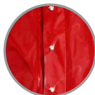
Двойная полоса-клапан на кнопках для защиты молнии