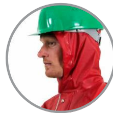
Затягивающийся шнурок и полоса-клапан для защиты горла